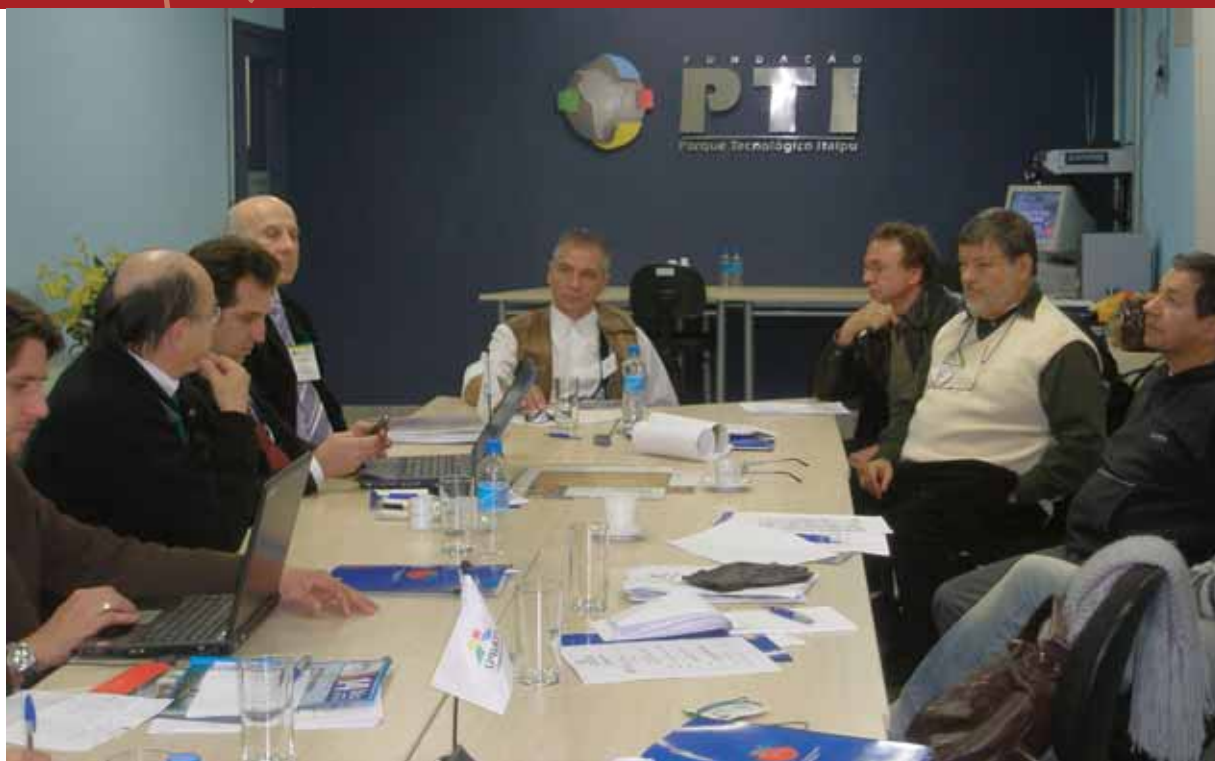
Asesoría de Comunicación Itaipu Binacional Caio Francisco Coronel