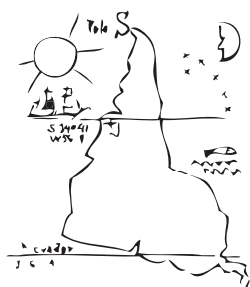
"(...) nuestro norte es el Sur."