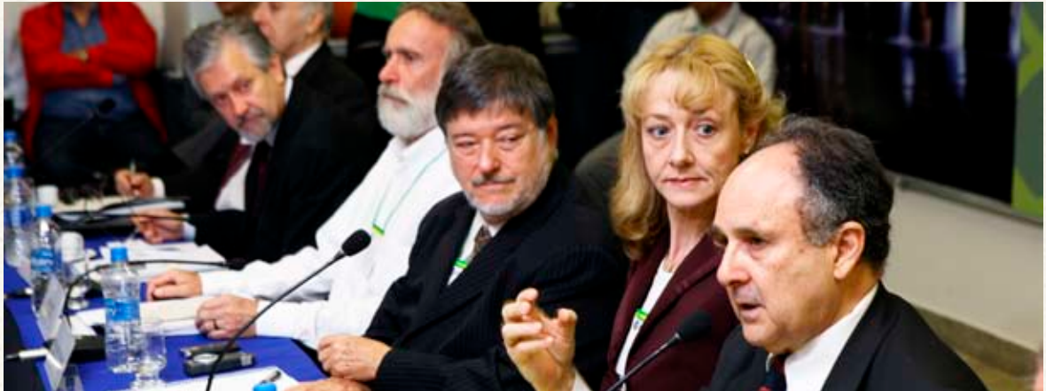
Senador Cristovam Buarque (PDT-DF), presidente Comissão de Educação, Cultura e Esporte do Senado

hoje, a maior necessidade de uma universidade devido à realidade global”. Trindade encerrou a exposição destacando as missões centrais da UNILA: fazer avançar o processo integração da região, com uma instituição aberta a professores e alunos do continente; promover redes de investigação avançada e a formação de recursos humanos de alto nível; além de criar um Centro de Estudos Avançados, visando a promoção de um pólo internacional de pesquisa.