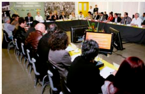
Debate sobre a criação da UNILA reúne políticos e acadêmicos do Mercosul, em setembro, em Foz do Iguaçu