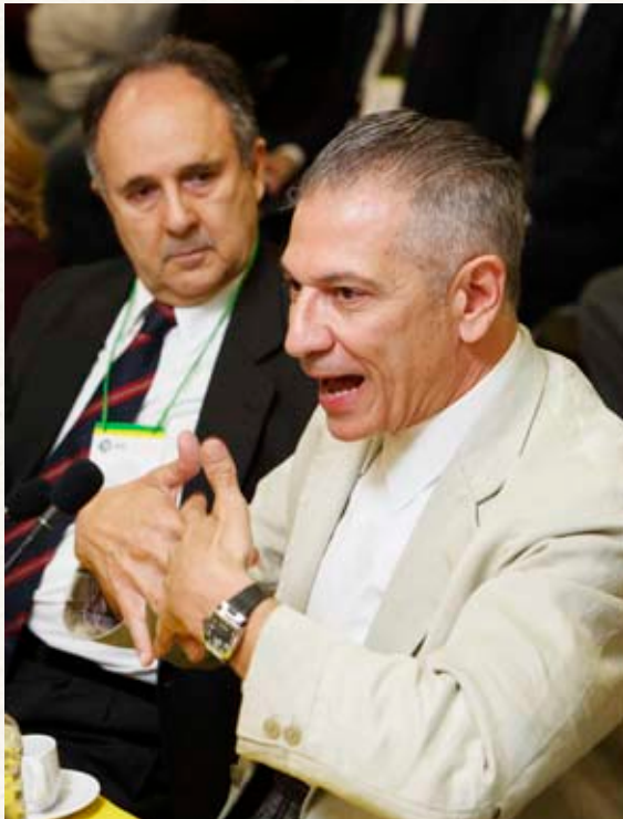
Deputado Ângelo Vanhoni (PT-PR), relator do projeto na Comissão de Educação e Cultura da Câmara dos Deputados

“A construção e a transmissão do saber têm uma função fundamental na estruturação de um futuro democrático para todos nós”, lembrou o deputado federal Ângelo Vanhoni (PT-PR), relator do Projeto 2878/08 na Comissão de Educação e Cultura da Câmara dos Deputados, ao ressaltar que as universidades participam da revolução de valores da sociedade. Nesse sentido, comentou que a UNILA pode auxiliar o aprimoramento da democracia e da cidadania a partir da produção do conhecimento. Ao avaliar que a integração é construída através de valores simbólicos, sugeriu maior ênfase no projeto da UNILA à cultura, à arte e à humanidade.