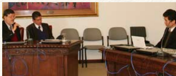
Projeto da UNILA é apresentado na Reunião Regional Sul do FAUBAI

Foi abordada a proposta integracionista e a inserção da nova instituição no programa de expansão e interiorização do ensino superior federal. Trindade