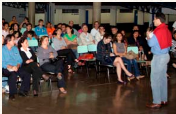
Apresentação do projeto da UNILA à comunidade da Vila C

a integração com a comunidade local. Ele estimulou os estudantes da região a ter a UNILA como um objetivo a ser alcançado, além de comentar que a universidade deverá trazer novas oportunidades de emprego e renda.