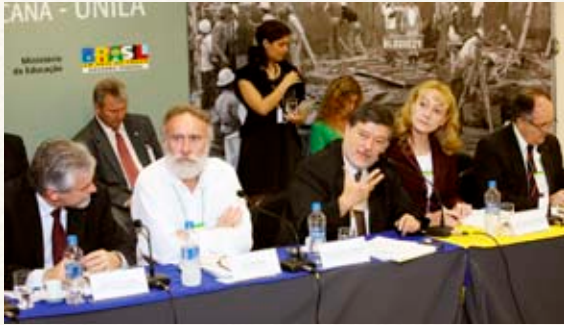
Presidente CI-UNILA apresenta Projeto de Lei e Exposição de Motivos

Durante a apresentação “UNILA: educação, ciência e tecnologia para a educação latino-americana”, que proporcionou uma visão histórica da criação e da diferença dos modelos de universidade implantados na América Latina por Portugal e Espanha, o presidente da CI-UNILA afirmou “que a integração regional é,