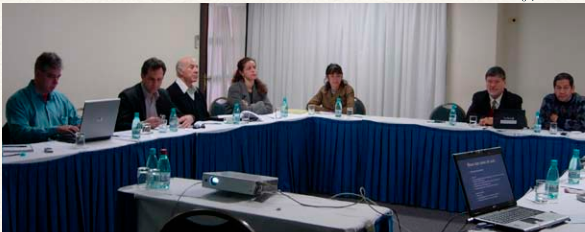
Comissão discute estruturação acadêmica da UNILA