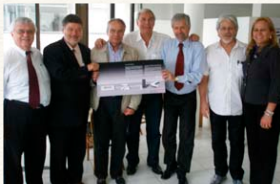
El despacho de Niemeyer entrega el proyecto arquitectónico de la UNILA