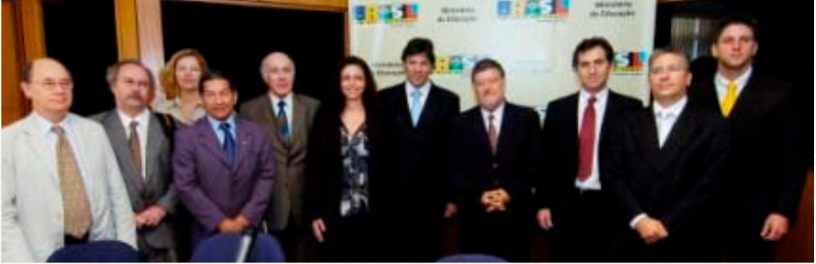
Miembros de la Comisión de Implementación de UNILA