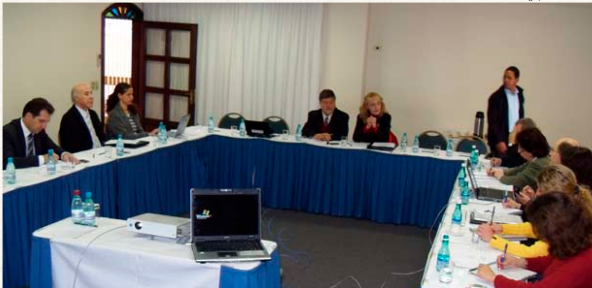
5ª Reunião CI-UNILA avalia Debate Público sobre a criação da Universidade

áreas de ensino e pesquisa, formação da biblioteca e realização do debate público.